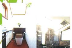
⑧ 3階トイレ 全自動お掃除トイレ。