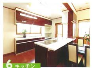
⑥ キッチン 作業効率アップとお掃除が楽になる工夫が随所に施されたシステム対面キッチン。地震対策も万全、安心のロック機能あり。