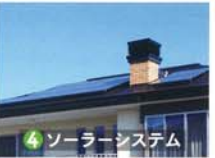
④ ソーラーシステム