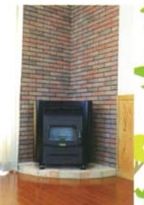
⑤ ペレットストーブ 煙が出ずらくらく簡単操作。炎を見ながらの生活は、個性ある空間の演出が出来て楽しさ一杯。