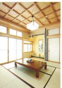
③ 1階和室 和の趣が何の違和感もなく家の雰囲気とマッチ。最上杉をふんだんに使用した明るい室内。