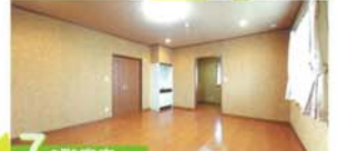
⑦ 2階寝室 思いのほか便利なミニキッチンと個人の収納スタイルに合わせて間仕切りが出来るウォークインクローゼットがあるゆとりの寝室。