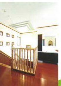
④ 2階ホール 洒落た飾り窓とニュアンスたつぷりの天井がオーナーのセンスの良さを感じさせる。