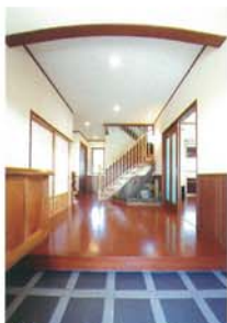
② 玄関ホール 白壁と最上杉のコントラストが家の顔に相応しい美しさを醸し出す、上品でモダンな空間。