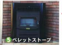
⑤ ペレットストーブ