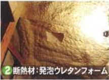
② 断熱材:発泡ウレタンフォーム