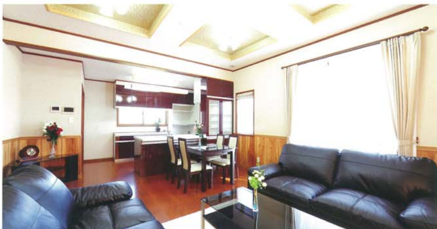
① リビングダイニング 家族がゆったりと過ごせる明るくモダンな室内。杉の木目を浮かび上がらせたくず取り仕上げの壁紙と美しい折上げ天井が落ち着いた心地よい空間を素敵に演出。